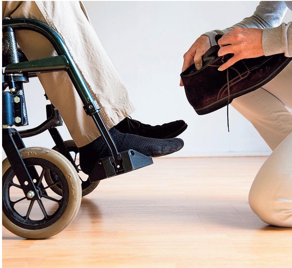
Een hulpverlener helpt een gehandicapte man bij het aantrekken van zijn schoenen.

Onzichtbare helden Om de mantelzorgers in Nederland in het zonnetje te zetten, staat deze week de Dag van de Mantelzorg weer op de kalender. Volgens